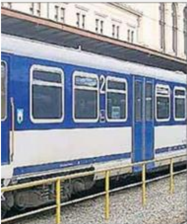
putničkog željezničkog prometa

ri linije koje se na području Varaždinske županije u potpunosti ukidaju te se neće dinim linijama, na snagu stupa 24. travnja te vrijedi do 13. prosinca ove godine