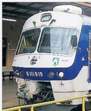
Zbog štrajka upitno je normalno odvijanje

Kako neslužbeno doznajemo, upitan je i putnički prijevoz s varaždinskog kolodvora jer već sada nedostaju loko-