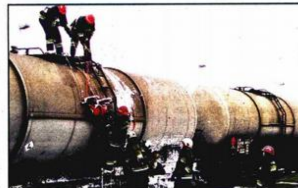
Sadržaj iz oštećene cisterne prepumpan je u drugu