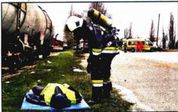
Nakon zbrinjavanja stradale osobe...